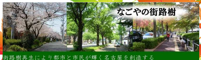
街路樹再生により都市と市民が輝く名古屋を創造する

良かれと思い勝手に枝を切ったり除草をすることは、条例違反のようですが、名古屋市では街路樹愛護会などのボランティアを募り、現在では団体が400程あり行政に代わり清掃・除草を行っているようです。清掃用ゴミ袋の支給や報奨金の支援もある様です。