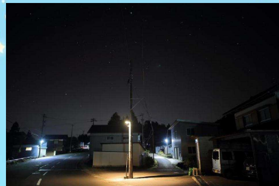
設置された光害対策モデル灯