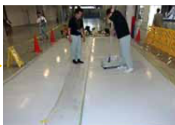
右側半分だけコーティングします