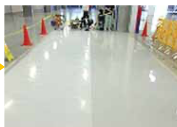
右半分コーティング完了(左半分は洗浄のみ)