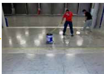
特殊洗剤を塗布しています