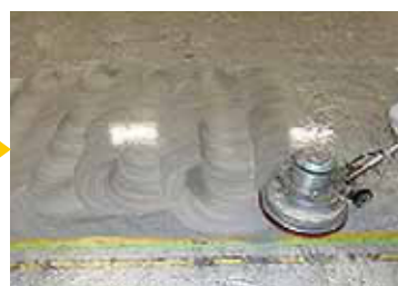
ポリッシャーで洗浄して汚れを除去します