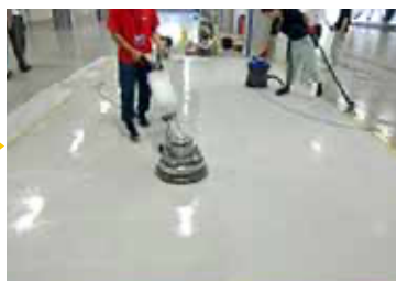
一旦綺麗にした後、特殊パットを使用して細かいキズを除去します