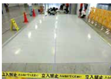
コーティングのための養生をします