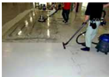
洗浄した汚水をバキュームします