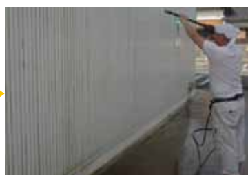
複雑な壁面においてもお任せ下さい！