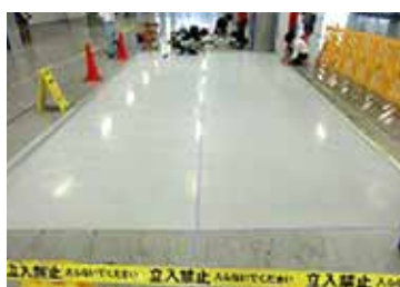
コーティングのための養生をします