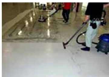
洗浄した汚水をバキュームします