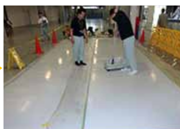
右側半分だけコーティングします