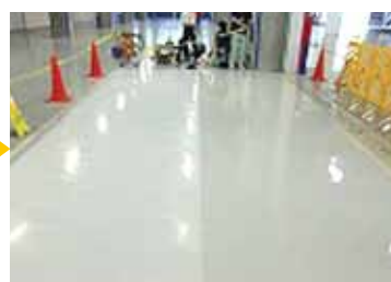
右半分コーティング完了(左半分は洗浄のみ)