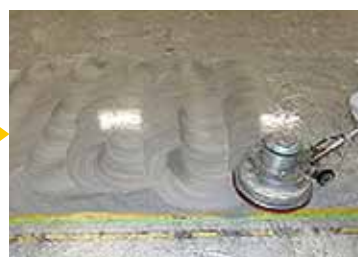
ポリッシャーで洗浄して汚れを除去します