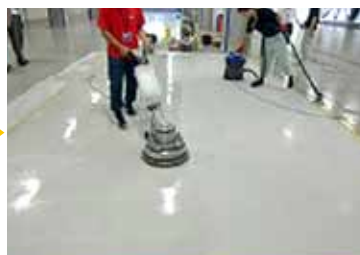
一旦綺麗にした後、特殊パットを使用して細かいキズを除去します