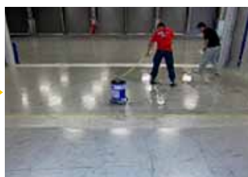
特殊洗剤を塗布しています